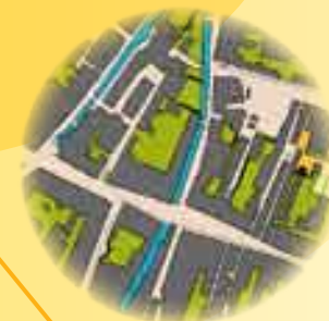
Esempio della cartina di Comacchio